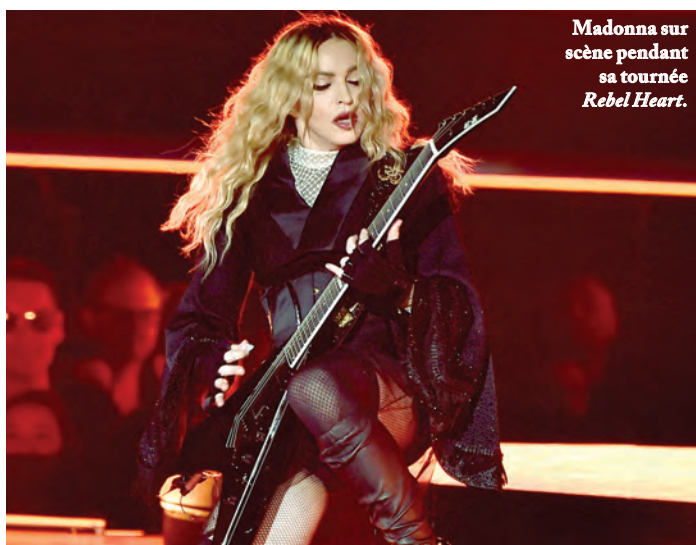
Madonna sur scène pendant sa tournée Rebel Heart.

Madonna a adopté un nouveau look bouclé pour sa tournée Rebel Heart — et si facile à recréer, même dans votre sommeil