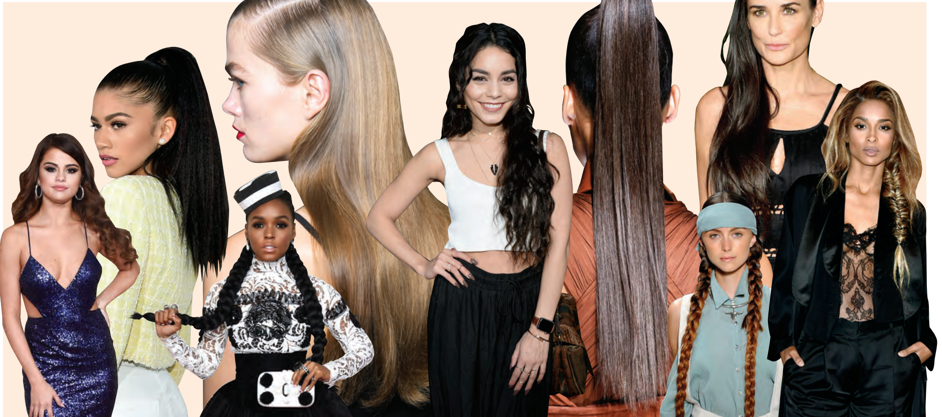
À partir de la gauche: Selena Gomez, Zendaya Coleman, Janelle Monáe, DKNY, Venssa Hudgens, Balmain, Mara Hoffman, Demi Moore et Ciara.

Il n'y a pas longtemps les cheveux ultras longs se réservaient aux personnages de contes de fées (personne ne coupe les cheveux de Raiponce). Mais les temps ont changé : les longues queues de cheval de Joan Smalls et de Kendall Jenner au défilé Printemps 2016 de Balmain sont des coiffures des temps modernes.